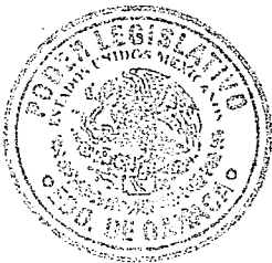
H. CONGRESO DEL ESTADO DE OAXACA DIP. EVA DIEGO CRUZ. DIP. EVA DIEGO CRUZ