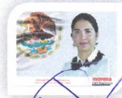
DIP. ELISA ZEREZA LAGUNAS. INTEGRANTE

LAS PRESENTES FIRMAS CORRESPONDEN A LA ACTA DE LA SESIÓN DE ORDINARIA DE LA COMISIÓN PERMANENTE COMISIÓN DE GOBERNACIÓN Y ASUNTOS AGRARIOS DE LA SEXAGÉSIMA CUARTA LEGISLATURA DEL HONORABLE CONGRESO DEL ESTADO, DE FECHA 31 DE AGOSTO DEL 2021.