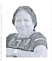
Dip. Leticia Socorro Collado Soto Presidenta GP. MORENA