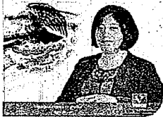
DIP. VICTORIA CRUZ VILLAR INTEGRANTE

COMISIÓN PERMANENTE DE GOBERNACIÓN Y ASUNTOS AGRARIOS HONORABLE H. CONGRESO DEL ESTADO DE OAXACA SECRETARÍA DE GOBIERNO