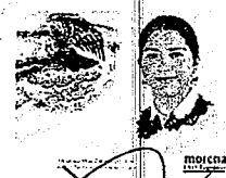
DIP. ELISA ZEPEDA LAGUNAS. INTEGRANTE

LAS PRESENTES FIRMAS CORRESPONDEN AL DICTAMEN EMITIDO POR LOS DIPUTADOS INTEGRANTES DE LA COMISIÓN PERMANENTE DE GOBERNACIÓN Y ASUNTOS AGRARIOS DE LA SEXAGÉSIMA CUARTA LEGISLATURA CONSTITUCIONAL DEL ESTADO, DENTRO DEL EXPEDIENTE CPGA/706/2021.