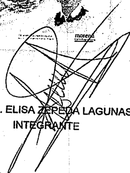
DIP. ELISA ZEPEDA LAGUNAS. INTEGRANTE

LAS PRESENTES FIRMAS CORRESPONDEN AL DICTAMEN EMITIDO POR LOS DIPUTADOS INTEGRANTES DE LA COMISIÓN PERMANENTE DE GOBERNACIÓN Y ASUNTOS AGRARIOS DE LA SEXAGÉSIMA CUARTA LEGISLATURA CONSTITUCIONAL DEL ESTADO, DENTRO DEL EXPEDIENTE CPGA/611/2020.