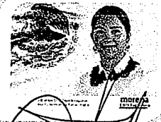
DIP. ELISA ZEPEDA LAGUNAS. INTEGRANTE

LAS PRESENTES FIRMAS CORRESPONDEN AL DICTAMEN EMITIDO POR LOS DIPUTADOS INTEGRANTES DE LA COMISIÓN PERMANENTE DE GOBERNACIÓN Y ASUNTOS AGRARIOS DE LA SEXAGÉSIMA CUARTA LEGISLATURA CONSTITUCIONAL DEL ESTADO, DENTRO DEL EXPEDIENTE CPGA/828/2021.