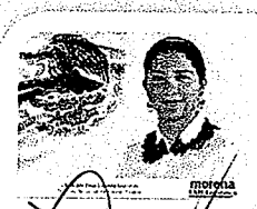
DIP. ELISA ZERCEDA LAGUNAS. INTEGRANTE

LAS PRESENTES FIRMAS CORRESPONDEN AL DICTAMEN EMITIDO POR LOS DIPUTADOS INTEGRANTES DE LA COMISIÓN PERMANENTE DE GOBERNACIÓN Y ASUNTOS AGRARIOS DE LA SEXAGÉSIMA CUARTA LEGISLATURA CONSTITUCIONAL DEL ESTADO, DENTRO DEL EXPEDIENTE CPGA/210, 213, 260 Y 261/2019.