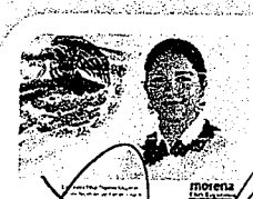
DIP. ELISA ZEPEDA LAGUNAS. INTEGRANTE

LAS PRESENTES FIRMAS CORRESPONDEN AL DICTAMEN EMITIDO POR LOS DIPUTADOS INTEGRANTES DE LA COMISIÓN PERMANENTE DE GOBERNACIÓN Y ASUNTOS AGRARIOS DE LA SEXAGÉSIMA CUARTA LEGISLATURA DEL CONGRESO DEL ESTADO DE OAXACA, DENTRO DE LOS EXPEDIENTES DE NÚMERO CPGA/200/2019, DEL ÍNDICE DE DICHA COMISIÓN.