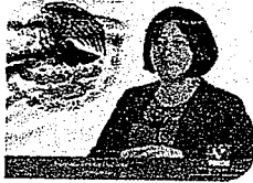
DIP. VICTORIA CRUZ VILLAR INTEGRANTE

EL CONGRESO DEL ESTADO DE OAXACA LXIV LEGISLATURA PRESIDENCIA DE LA COMISIÓN PERMANENTE DE GOBERNACIÓN Y ASUNTOS AGRARIOS