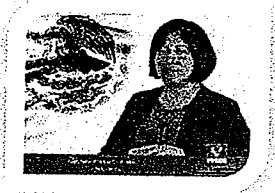
DIP. VICTORIA CRUZ VILLAR INTEGRANTE

EL CONGRESO DEL ESTADO DE OAXACA LXIV LEGISLATURA PRESIDENCIA DE LA COMISIÓN PERMANENTE DE GOBERNACIÓN Y ASUNTOS AGRARIOS