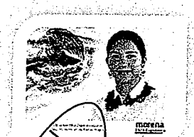
DIP. ELISA ESPEDA LAGUNAS. INTEGRANTE

LAS PRESENTES FIRMAS CORRESPONDEN AL DICTAMEN EMITIDO POR LOS DIPUTADOS INTEGRANTES DE LA COMISIÓN PERMANENTE DE GOBERNACIÓN Y ASUNTOS AGRARIOS DE LA SEXAGÉSIMA CUARTA LEGISLATURA CONSTITUCIONAL DEL ESTADO, DENTRO DEL EXPEDIENTE CPGA/892/2021.