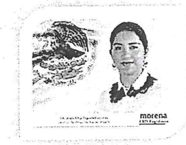
DIP. ELISA ZEPEDA LAGUNAS. INTEGRANTE

LAS PRESENTES FIRMAS CORRESPONDEN AL DICTAMEN EMITIDO POR LOS DIPUTADOS INTEGRANTES DE LA COMISIÓN PERMANENTE DE GOBERNACIÓN Y ASUNTOS AGRARIOS DE LA SEXAGÉSIMA CUARTA LEGISLATURA DEL HONORABLE CONGRESO DEL ESTADO LIBRE Y SOBERANO DE OAXACA, DENTRO DEL EXPEDIENTE NÚMERO CPGA/168/2019.