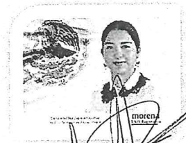
DIP. ELISA ZEPEDA LAGUNAS. INTEGRANTE

LAS PRESENTES FIRMAS CORRESPONDEN AL DICTAMEN EMITIDO POR LOS DIPUTADOS INTEGRANTES DE LA COMISIÓN PERMANENTE DE GOBERNACIÓN Y ASUNTOS AGRARIOS DE LA SEXAGÉSIMA CUARTA LEGISLATURA CONSTITUCIONAL DEL ESTADO, DENTRO DEL EXPEDIENTE CPG/576/2018.