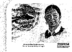
DIP. ELISA DEPEDA LAGUNAS. INTEGRANTE

LAS PRESENTES FIRMAS CORRESPONDEN AL DICTAMEN EMITIDO POR LOS DIPUTADOS INTEGRANTES DE LA COMISIÓN PERMANENTE DE GOBERNACIÓN Y ASUNTOS AGRARIOS DE LA SEXAGÉSIMA CUARTA LEGISLATURA CONSTITUCIONAL DEL ESTADO, DENTRO DEL EXPEDIENTES CPGA/41/2019, CPGA/45/2019 y CPGA/49/2019.