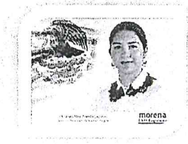
DIP. ELISA ZEPEDA LAGUNAS. INTEGRANTE

LAS PRESENTES FIRMAS CORRESPONDEN AL DICTAMEN EMITIDO POR LOS DIPUTADOS INTEGRANTES DE LA COMISIÓN PERMANENTE DE GOBERNACIÓN Y ASUNTOS AGRARIOS DE LA SEXAGÉSIMA CUARTA LEGISLATURA CONSTITUCIONAL DEL ESTADO, DENTRO DEL EXPEDIENTE CPG/126/2017.