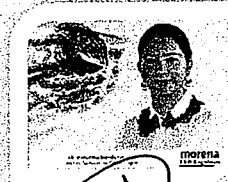
DIP. ELISA ZEPEDA LAGUNAS. INTEGRANTE

LAS PRESENTES FIRMAS CORRESPONDEN AL DICTAMEN EMITIDO POR LOS DIPUTADOS INTEGRANTES DE LA COMISIÓN PERMANENTE DE GOBERNACIÓN Y ASUNTOS AGRARIOS DE LA SEXAGÉSIMA CUARTA LEGISLATURA CONSTITUCIONAL DEL ESTADO, DENTRO DEL EXPEDIENTE CPGA/301/2019.