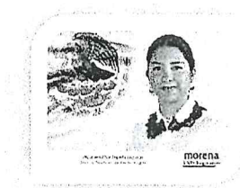
DIP. ELISA ZEPEDA LAGUNAS. INTEGRANTE

LAS PRESENTES FIRMAS CORRESPONDEN AL DICTAMEN EMITIDO POR LOS DIPUTADOS INTEGRANTES DE LA COMISIÓN PERMANENTE DE GOBERNACIÓN Y ASUNTOS AGRARIOS DE LA SEXAGÉSIMA CUARTA LEGISLATURA DEL HONORABLE CONGRESO DEL ESTADO LIBRE Y SOBERANO DE OAXACA, DENTRO DE LOS EXPEDIENTES NÚMERO CPGA/5/2018.