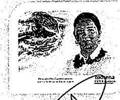
DIP. ELISA ZEPEDA LAGUNAS. INTEGRANTE

LAS PRESENTES FIRMAS CORRESPONDEN AL DICTAMEN EMITIDO POR LOS DIPUTADOS INTEGRANTES DE LA COMISIÓN PERMANENTE DE GOBERNACIÓN Y ASUNTOS AGRARIOS DE LA SEXAGÉSIMA CUARTA LEGISLATURA DEL HONORABLE CONGRESO DEL ESTADO LIBRE Y SOBERANO DE OAXACA, DENTRO DE LOS EXPEDIENTES NÚMERO CPGA/189/2019.