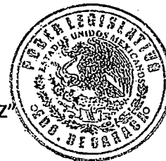
DIP. GRISELDA SOSA VÁSQUEZ

EL CONGRESO DEL ESTADO DE OAXACA LXIV LEGISLATURA DIP. GRISELDA SOSA VÁSQUEZ DISTRITO IX EN TLÁN DE JARAL