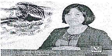
DIP. VICTORIA CRUZ VILLAR