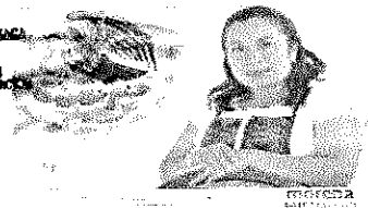
DIP. ARCELIA LÓPEZ HERNÁNDEZ

EL CONGRESO DEL ESTADO DE JALISCO EXPL. LEGISLATIVA PRESENTE EN LA COMISIÓN PERMANENTE DE GRUPOS EN SITUACIÓN DE VULNERABILIDAD