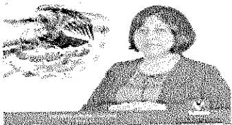
DIP. VICTORIA CRUZ VILLAR