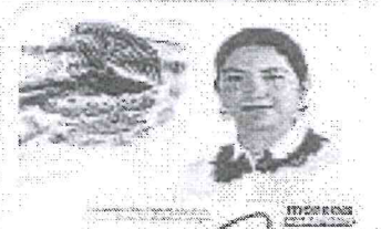
DIP. ELISA ZEPEDA LAGUNAS INTEGRANTE

LAS PRESENTES FIRMAS CORRESPONDEN A LOS DICTAMEN EMITIDO POR LOS DIPUTADOS INTEGRANTES DE LA COMISIÓN PERMANENTE DE GOBERNACIÓN Y ASUNTOS AGRARIOS DE LA SEXAGÉSIMA CUARTA LEGISLATURA CONSTITUCIONAL DEL ESTADO, DENTRO DE LOS EXPEDIENTES NÚMERO CPGA/180/2018, CPGA/190/2018 Y CPGA/208/2018 (ACUMULADOS) DEL ÍNDICE DE DICHA COMISIÓN.