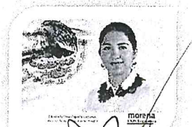
DIP. ELISA ZEPEDA LAGUNAS. INTEGRANTE

LAS PRESENTES FIRMAS CORRESPONDEN AL DICTAMEN EMITIDO POR LOS DIPUTADOS INTEGRANTES DE LA COMISIÓN PERMANENTE DE GOBERNACIÓN Y ASUNTOS AGRARIOS DE LA SEXAGÉSIMA CUARTA LEGISLATURA CONSTITUCIONAL DEL ESTADO, DENTRO DEL EXPEDIENTE CPG/262/2017.