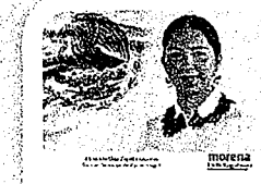
DIP. ELISA DEPEDA LAGUNAS. INTEGRANTE

LAS PRESENTES FIRMAS CORRESPONDEN AL DICTAMEN EMITIDO POR LOS DIPUTADOS INTEGRANTES DE LA COMISIÓN PERMANENTE DE GOBERNACIÓN Y ASUNTOS AGRARIOS DE LA SEXAGÉSIMA CUARTA LEGISLATURA CONSTITUCIONAL DEL ESTADO, DENTRO DEL EXPEDIENTES CPGA/41/2019, CPGA/45/2019 y CPGA/49/2019.