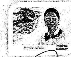
DIP. ELISA ZEPEDA LAGUNAS. INTEGRANTE

LAS PRESENTES FIRMAS CORRESPONDEN AL DICTAMEN EMITIDO POR LOS DIPUTADOS INTEGRANTES DE LA COMISIÓN PERMANENTE DE GOBERNACIÓN Y ASUNTOS AGRARIOS DE LA SEXAGÉSIMA CUARTA LEGISLATURA DEL HONORABLE CONGRESO DEL ESTADO LIBRE Y SOBERANO DE OAXACA, DENTRO DE LOS EXPEDIENTES NÚMERO CPGA/171/2019.