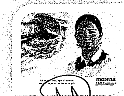
DIP. ELISA ZEBEDA LAGUNAS. INTEGRANTE

LAS PRESENTES FIRMAS CORRESPONDEN AL DICTAMEN EMITIDO POR LOS DIPUTADOS INTEGRANTES DE LA COMISIÓN PERMANENTE DE GOBERNACIÓN Y ASUNTOS AGRARIOS DE LA SEXAGÉSIMA CUARTA LEGISLATURA CONSTITUCIONAL DEL ESTADO, DENTRO DEL EXPEDIENTE CPGA/198/2019.