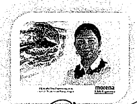
DIP. ELISA ZEPEDA LAGUNAS. INTEGRANTE

LAS PRESENTES FIRMAS CORRESPONDEN AL DICTAMEN EMITIDO POR LOS DIPUTADOS INTEGRANTES DE LA COMISIÓN PERMANENTE DE GOBERNACIÓN Y ASUNTOS AGRARIOS DE LA SEXAGÉSIMA CUARTA LEGISLATURA CONSTITUCIONAL DEL ESTADO, DENTRO DEL EXPEDIENTE CPGA/279/2019.