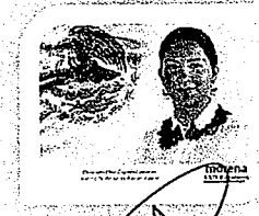
DIP. ELISA ZEPEDA LAGUNAS. INTEGRANTE

LAS PRESENTES FIRMAS CORRESPONDEN AL DICTAMEN EMITIDO POR LOS DIPUTADOS INTEGRANTES DE LA COMISIÓN PERMANENTE DE GOBERNACIÓN Y ASUNTOS AGRARIOS DE LA SEXAGÉSIMA CUARTA LEGISLATURA DEL HONORABLE CONGRESO DEL ESTADO LIBRE Y SOBERANO DE OAXACA, DENTRO DE LOS EXPEDIENTES NÚMERO CPGA/189/2019.