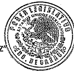
DIP. GRISELDA SOSA VÁSQUEZ

EL CONGRESO DEL ESTADO DE OAXACA LXIV LEGISLATURA DIP. GRISELDA SOSA VÁSQUEZ DISTRITO IX EN EL AÑO DE 2020