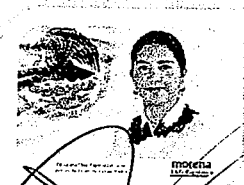
DIP. ELISA ZEREDA LAGUNAS. INTEGRANTE

LAS PRESENTES FIRMAS CORRESPONDEN AL DICTAMEN EMITIDO POR LOS DIPUTADOS INTEGRANTES DE LA COMISIÓN PERMANENTE DE GOBERNACIÓN Y ASUNTOS AGRARIOS DE LA SEXAGÉSIMA CUARTA LEGISLATURA DEL CONGRESO DEL ESTADO DE OAXACA, DENTRO DE LOS EXPEDIENTES DE NÚMERO CPG/223,227, 235,240,245,301,328/2017 y CPG/371/2018, DEL ÍNDICE DE DICHA COMISIÓN.