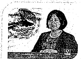
DIP. VICTORIA CRUZ VILLAR INTEGRANTE

COMISIÓN PERMANENTE DE GOBERNACIÓN Y ASUNTOS AGRARIOS H. CONGRESO DEL ESTADO DE OAXACA LXIV LEGISLATURA