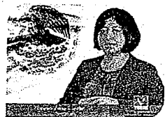
DIP. VICTORIA CRUZ VILLAR INTEGRANTE

EL CONGRESO DEL ESTADO DE OAXACA LXIV LEGISLATURA PRESIDENCIA DE LA COMISIÓN PERMANENTE DE GOBERNACIÓN Y ASUNTOS AGRARIOS