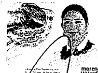
DIP. ELISA ZEPEDA LAGUNAS. INTEGRANTE

LAS PRESENTES FIRMAS CORRESPONDEN AL DICTAMEN EMITIDO POR LOS DIPUTADOS INTEGRANTES DE LA COMISIÓN PERMANENTE DE GOBERNACIÓN Y ASUNTOS AGRARIOS DE LA SEXAGÉSIMA CUARTA LEGISLATURA DEL HONORABLE CONGRESO DEL ESTADO LIBRE Y SOBERANO DE OAXACA, DENTRO DEL EXPEDIENTE NÚMERO CPGA/671/2021.