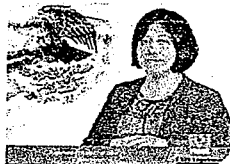
DIP. VICTORIA CRUZ VILLAR INTEGRANTE

H. CONGRESO DEL ESTADO DE OAXACA LXIV LEGISLATURA COMISIÓN PERMANENTE DE GOBERNACIÓN Y ASUNTOS AGRARIOS