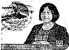
DIP. VICTORIA CRUZ VILLAR INTEGRANTE

COMISIÓN PERMANENTE DE GOBERNACIÓN Y ASUNTOS AGRARIOS LXIV LEGISLATURA PRESIDENCIA DE LA COMISIÓN PERMANENTE DE GOBERNACIÓN Y ASUNTOS AGRARIOS