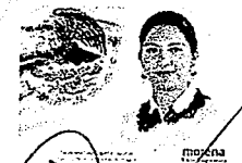
DIP. ELISA PINEDA LAGUNAS. INTEGRANTE

LAS PRESENTES FIRMAS CORRESPONDEN AL DICTAMEN EMITIDO POR LOS DIPUTADOS INTEGRANTES DE LA COMISIÓN PERMANENTE DE GOBERNACIÓN Y ASUNTOS AGRARIOS DE LA SEXAGÉSIMA CUARTA LEGISLATURA DEL HONORABLE CONGRESO DEL ESTADO LIBRE Y SOBERANO DE OAXACA, DENTRO DEL EXPEDIENTE NÚMERO CPGA/690/2021.