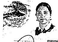
DIP. ELISA ZEPEDA LAGUNAS. INTEGRANTE

LAS PRESENTES FIRMAS CORRESPONDEN AL DICTAMEN EMITIDO POR LOS DIPUTADOS INTEGRANTES DE LA COMISIÓN PERMANENTE DE GOBERNACIÓN Y ASUNTOS AGRARIOS DE LA SEXAGÉSIMA CUARTA LEGISLATURA CONSTITUCIONAL DEL ESTADO, DENTRO DEL EXPEDIENTE CPGA/678/2021.