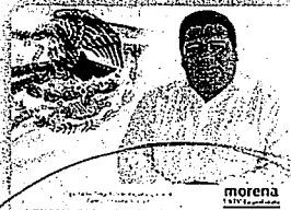
DIP. ÁNGEL DOMÍNGUEZ ESCOBAR

"2021. AÑO DEL RECONOCIMIENTO AL PERSONAL DE SALUD, POR LA LUCHA CONTRA EL VIRUS SARS-CoV2, COVID 19"