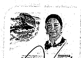
DIP. ELISA ZEPEDA LAGUNAS. INTEGRANTE

LAS PRESENTES FIRMAS CORRESPONDEN AL DICTAMEN EMITIDO POR LOS DIPUTADOS INTEGRANTES DE LA COMISIÓN PERMANENTE DE GOBERNACIÓN Y ASUNTOS AGRARIOS DE LA SEXAGÉSIMA CUARTA LEGISLATURA DEL HONORABLE CONGRESO DEL ESTADO LIBRE Y SOBERANO DE OAXACA, DENTRO DEL EXPEDIENTE NÚMERO CPGA/766/2021.