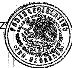
DIP. MAGALY LÓPEZ DOMÍNGUEZ

H. CONGRESO DEL ESTADO DE OAXACA LXIV LEGISLATURA DIP. MAGALY LÓPEZ DOMÍNGUEZ DISTRITO XV SANTA CECILIA TUNDUCOTLÁN