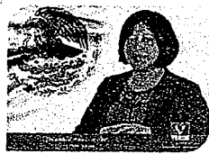
DIP. VICTORIA CRUZ VILLAR INTEGRANTE

EL CONGRESO DEL ESTADO DE OAXACA LXIV LEGISLATURA PRESIDENCIA DE LA COMISIÓN PERMANENTE DE GOBERNACIÓN Y ASUNTOS AGRARIOS