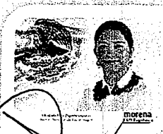
DIP. ELISA CEBEDA LAGUNAS. INTEGRANTE

LAS PRESENTES FIRMAS CORRESPONDEN AL DICTAMEN EMITIDO POR LOS DIPUTADOS INTEGRANTES DE LA COMISIÓN PERMANENTE DE GOBERNACIÓN Y ASUNTOS AGRARIOS DE LA SEXAGÉSIMA CUARTA LEGISLATURA DEL HONORABLE CONGRESO DEL ESTADO LIBRE Y SOBERANO DE OAXACA, DENTRO DEL EXPEDIENTE NÚMERO CPGA/868/2021.