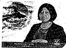
DIP. VICTORIA CRUZ VILLAR INTEGRANTE

EL CONGRESO DEL ESTADO DE OAXACA LXIV LEGISLATURA PRESIDENCIA DE LA COMISIÓN PERMANENTE DE GOBERNACIÓN Y ASUNTOS AGRARIOS