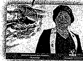
DIP. AURORA BERTHA LÓPEZ ACEVEDO

LA PRESENTE HOJA CON FIRMAS CORRESPONDE AL DICTAMEN DE LOS EXPEDIENTES 39 Y 186, DEL ÍNDICE DE LA COMISIÓN PERMANENTE DE PROTECCIÓN CIVIL, Y DE PRESUPUESTO Y PROGRAMACIÓN, RESPECTIVAMENTE, DE LA SEXAGÉSIMA CUARTA LEGISLATURA DEL H. CONGRESO DEL ESTADO DE OAXACA.