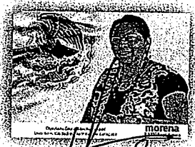
DIP. GLORIA SÁNCHEZ LÓPEZ

"2021. AÑO DEL RECONOCIMIENTO AL PERSONAL DE SALUD, POR LA LUCHA CONTRA EL VIRUS SARS-CoV2, COVID 19"