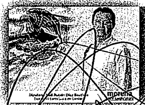
DIP. SAÚL RUBÉN DÍAZ BAUTISTA PRESIDENTE

LA PRESENTE HOJA CON FIRMAS CORRESPONDE AL DICTAMEN DE LOS EXPEDIENTES 39 Y 186, DEL ÍNDICE DE LAS COMISIONES PERMANENTES UNIDAS DE PROTECCIÓN CIVIL, Y DE PRESUPUESTO Y PROGRAMACIÓN, RESPECTIVAMENTE, DE LA SEXAGÉSIMA CUARTA LEGISLATURA DEL H. CONGRESO DEL ESTADO DE OAXACA.