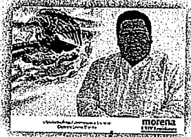
DIP. ÁNGEL DOMÍNGUEZ ESCOBAR