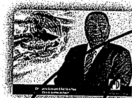
DIP. GUSTAVO DÍAZ SÁNCHEZ