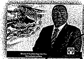
DIP. GUSTAVO DÍAZ SÁNCHEZ