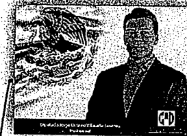
DIP. JORGE OCTAVIO VILLACAÑA JIMÉNEZ

LA PRESENTE HOJA CON FIRMAS CORRESPONDE AL DICTAMEN DE LOS EXPEDIENTES 39 Y 186, DEL ÍNDICE DE LAS COMISIONES PERMANENTES UNIDAS DE PROTECCIÓN CIVIL, Y DE PRESUPUESTO Y PROGRAMACIÓN, RESPECTIVAMENTE, DE LA SEXAGÉSIMA CUARTA LEGISLATURA DEL H. CONGRESO DEL ESTADO DE OAXACA.