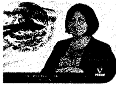
DIP. VICTORIA CRUZ VILLAR INTEGRANTE

EL CONGRESO DEL ESTADO DE OAXACA LXIV LEGISLATURA PRESIDENCIA DE LA COMISIÓN PERMANENTE DE GOBERNACIÓN Y ASUNTOS AGRARIOS