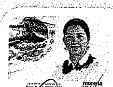
DIP. ELISA FEREDA LAGUNAS. INTEGRANTE

LAS PRESENTES FIRMAS CORRESPONDEN AL DICTAMEN EMITIDO POR LOS DIPUTADOS INTEGRANTES DE LA COMISIÓN PERMANENTE DE GOBERNACIÓN Y ASUNTOS AGRARIOS DE LA SEXAGÉSIMA CUARTA LEGISLATURA CONSTITUCIONAL DEL ESTADO, DENTRO DEL EXPEDIENTE CPGA/844/2021.