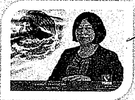
DIP. VICTORIA CRUZ VILLAR INTEGRANTE

EL CONGRESO DEL ESTADO DE OAXACA LXIV LEGISLATURA PRESIDENCIA DE LA COMISIÓN PERMANENTE DE GOBERNACIÓN Y ASUNTOS AGRARIOS