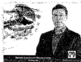
DIP. JÓRGE OCTAVIO VILLACAÑA JIMÉNEZ

LA PRESENTE HOJA CON FIRMAS CORRESPONDE AL DICTAMEN DE LOS EXPEDIENTES 53 Y 58, DEL ÍNDICE DE LA COMISIÓN PERMANENTE DE PROTECCIÓN CIVIL, DE LA SEXAGÉSIMA CUARTA LEGISLATURA DEL H. CONGRESO DEL ESTADO DE OAXACA.