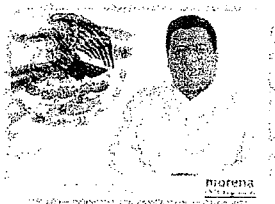
DIP. ÁNGEL DOMÍNGUEZ ESCOBAR

"2021. AÑO DEL RECONOCIMIENTO AL PERSONAL DE SALUD, POR LA LUCHA CONTRA EL VIRUS SARS-CoV2, COVID 19"