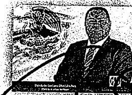
DIP. GUSTAVO DIAZ SANCHEZ