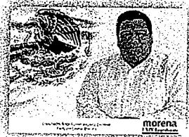
DIP. ÁNGEL DOMÍNGUEZ ESCOBAR