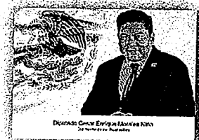
DIP. CÉSAR ENRIQUE MORALES NIÑO

LA PRESENTE HOJA CON FIRMAS CORRESPONDE AL DICTAMEN DE LOS EXPEDIENTES 48 Y 337, DEL ÍNDICE DE LA COMISIÓN PERMANENTE DE PROTECCIÓN CIVIL, Y DE SALUD, RESPECTIVAMENTE, DE LA SEXAGÉSIMA CUARTA LEGISLATURA DEL H. CONGRESO DEL ESTADO DE OAXACA.