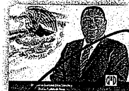
DIP. GUSTAVO DÍAZ SÁNCHEZ