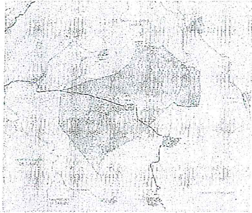
PLANO DE ZONIFICACIÓN CATASTRAL MAGDALENA PEÑASCO

Artículo 13. La tasa de este impuesto será del 0.5% anual sobre el valor catastral del inmueble.