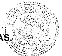
H. CONGRESO DEL ESTADO DE OAXACA LXV LEGISLATURA DIP. SAMUEL GURRIÓN MATÍAS