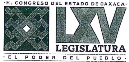
DIP. CLELIA TOLEDO BERNAL