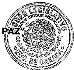
DIP. PABLO DÍAZ JIMÉNEZ.

EL CONGRESO DEL ESTADO DE OAXACA LXV LEGISLATURA DIP. PABLO DÍAZ JIMÉNEZ DISTRITO X SAN PEDRO Y SAN PABLO AYUTLA