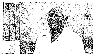
Derechohabiente de la Pensión para Adultos Mayores

Comunicado 052.- El registro se realizará en módulos y por etapas, con prioridad en municipios más pobres, por lo que es importante esperar convocatorias en cada localidad.