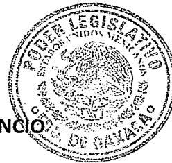
DIP. HORACIO SOSA VILLAVICENCIO

Palacio Legislativo de San Raymundo Jalpan, Oaxaca, el 15 de marzo de 2022.